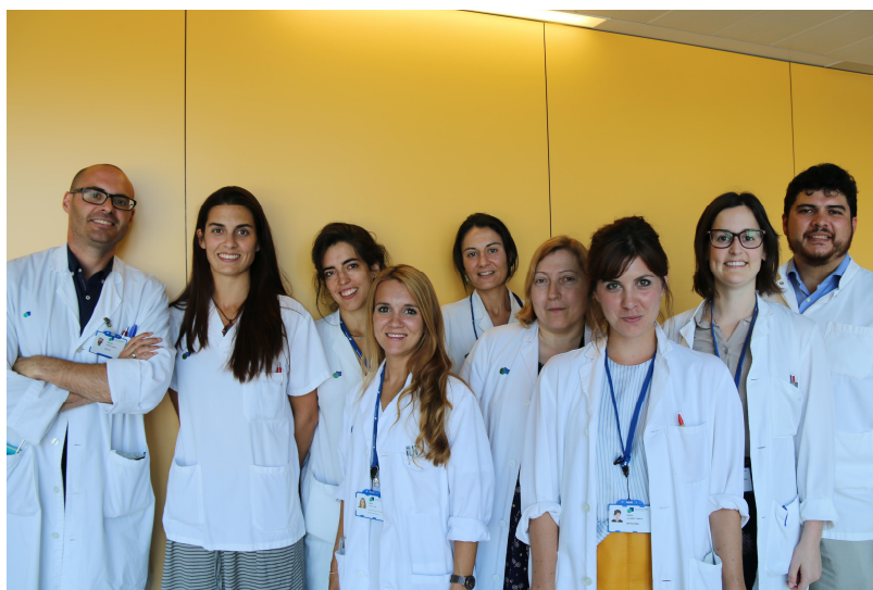
Equip del Servei de Cirurgia Pediàtrica del Parc Taulí

Fins la irrupció de la Taulinoplàstia l'any 2012, el 'pectus excavatum' es corregia quirúrgicament mitjançant la cirurgia oberta (Toracoplàstia de Ravitch-Welch) o la mínimament invasiva amb la col·locació d'una barra de Nuss (toracoplàstia percutània vídeoassistida de Nuss)