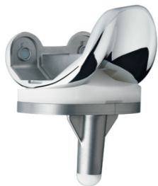
Prótesis de rodilla